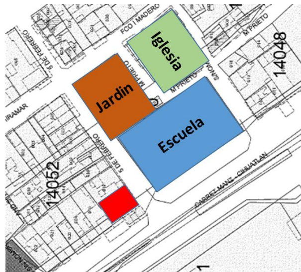
Imagen # 1

De la imagen anterior, esta Comisión considera relevante y tema de análisis la situación actual de las áreas marcadas como públicas que se encuentran cercanas al inmueble en el cual se ha solicitado su apertura, toda vez que en los mismos como es sabido presentan una gran afluencia de niños, niñas y adolescentes, considerado como sector vulnerable y prioritario para los tres niveles de gobierno, por lo que la venta de bebidas alcohólicas a una distancia muy cercana podría propiciar su consumo, por tal motivo la decisión y actuación de este Ayuntamiento debe velar y cumplir con el principio del interés superior de la niñez, consagrado en el párrafo noveno, del artículo 4º, de la Constitución Política de los Estados Unidos Mexicanos y en la Convención sobre los Derechos del Niño, entendiéndose como un principio jurídico amplio que tiene al menos dos grandes conceptos: por un lado, es un derecho que tienen todas las niñas, niños y adolescentes de ser considerados prioridad en las acciones o decisiones que les afecten en lo individual o en grupo; por otro lado, es una obligación de todas las instancias públicas y privadas tomarlo como base en las medidas que adopten e impacten a este grupo de la población.